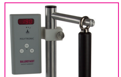
Temperaturregler mit Aufhängevorrichtung für Siegelkopf

Das Gerät erfüllt die grundlegenden Anforderungen der Richtlinie 2006/95/EG (Niederspannungsrichtlinie).